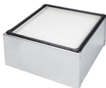
HEPA filtr AFR H14 PAP 850/650 minimální účinnost filtrace 99,995% dle EN-1822