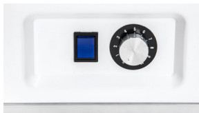
potenciometr - volba průtoku