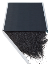
AFR CA PAP 650 nebo AFR VOC PAP 650 uhlíkový filtr