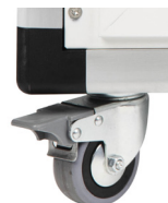
brzda na kolečku